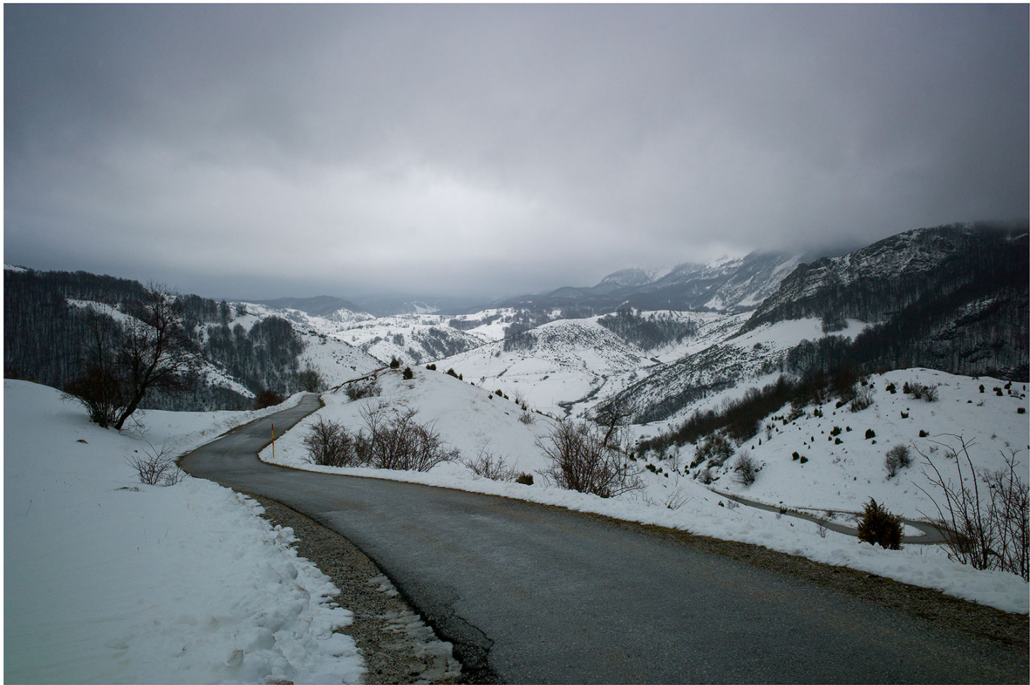
Umoljani – Bosnië-Herzegovina